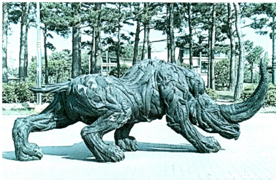
«Старые» носороги в макетах наружно рекламы